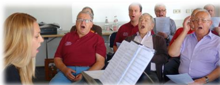
Erst die Probenarbeit...