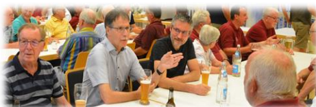
...dann die Geselligkeit.

Donnerstags, 19:30 Uhr bis 21:00 Uhr, anschließend zwangloses geselliges Beisammensein. Jeweils im Dorfgemeinschaftshaus Dielelshheim, Schwandorfstraße 42/1.